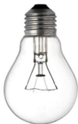
(لامپ رشته ای)

تلفن پشتیبانی : 051 552 68992 آدرس ما در شبکه های اجتماعی : @electronic20_ir